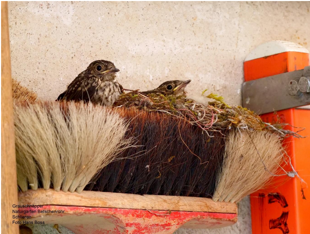
Grauschnäpper Naturgarten Betschenrohr Schlieren